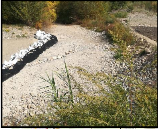
Aval immédiat passage à gué « chantier routier » d'Estagel