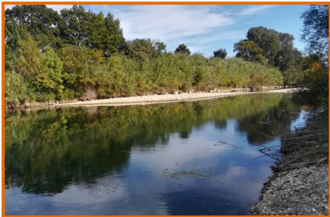
Aval pont du chemin de fer à Rivesaltes