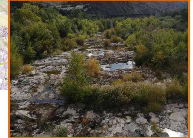
Aval immédiat passage à gué d'Estagel