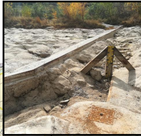
Amont immédiat station de jaugeage du Mas de Jau