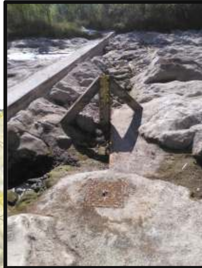
Amont immédiat station de jaugeage du Mas de Jau