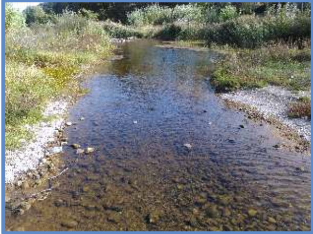
Aval immédiat passage à gué d'Estagel