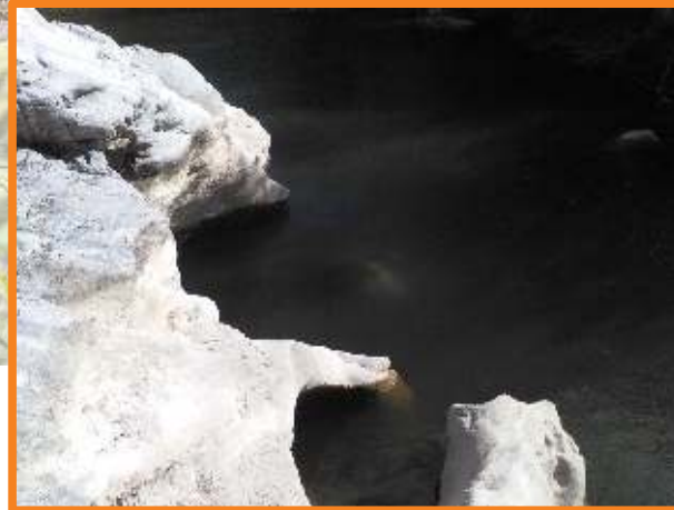
Gouffre en amont du Mas de Jau