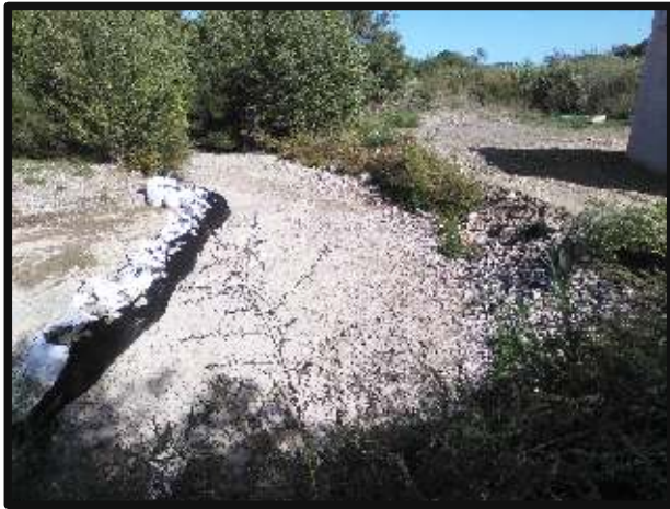
Aval immédiat passage à gué « chantier