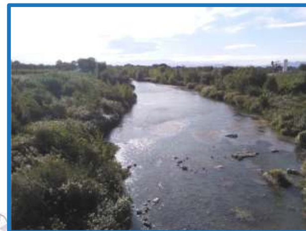
Amont pont de la RD11 à St Laurent-de-la-Salanque