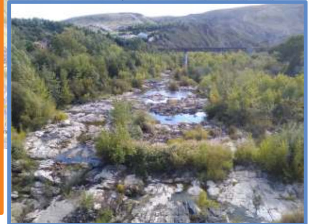
Amont immédiat pont RD 59 à Case-de-Pene