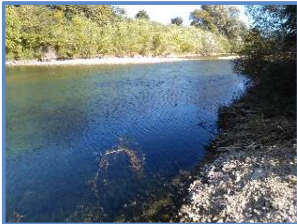
Aval pont du chemin de fer à Rivesaltes