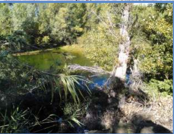
Aval éloigné sablière d'Espira