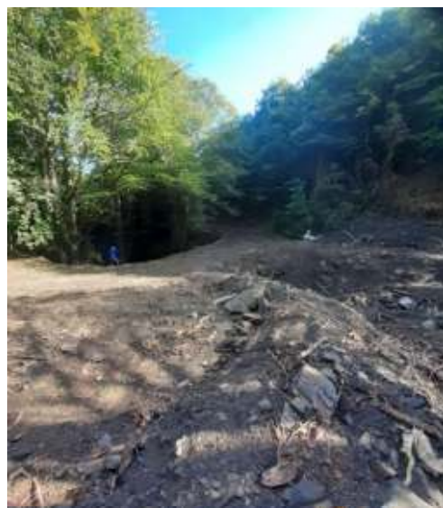
Chantier sur la Rivierette à Montfort-sur-Boulzane : Avant à droite – Après à gauche

Par ailleurs, le SMBVA réalise chaque année des chantiers de restauration et d'entretien des cours dans le cadre d'un programme pluriannuel sur l'ensemble du bassin versant de l'Agly. Pour cette année, 15 chantiers sont ainsi en cours de réalisation depuis l'automne 2021, soit 23 km de travaux sur 14 communes du bassin versant. Ces travaux consistent à dévégétaliser les atterrissements, supprimer les embâcles et abattre les arbres menaçant de tomber dans les cours d'eau. Ces actions sont soutenues par l'Union Européenne (FEDER), l'Agence de l'Eau, le Département de l'Aude et la Région Occitanie pour un montant de 194 000 euros HT.