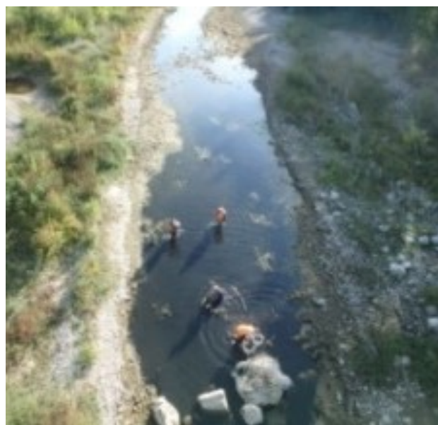
Ci-dessus : une pêche de sauvetage à Estagel Ci-dessous : l'Agly à sec à Rivesaltes

L'Agly est marqué par un fonctionnement dit atypique lié à la présence de zones de pertes et de résurgences karstiques à l'aval d'Estagel (jusqu'à 1000 l/s infiltrés). Naturellement, l'Agly est donc un fleuve à écoulements intermittents. En fonction de la date d'arrêt du soutien d'étiage par le barrage et de l'arrivée des pluies d'automne, les assecs peuvent durer plusieurs semaines, comme en 2019, ou plusieurs mois comme en 2017 et 2021.