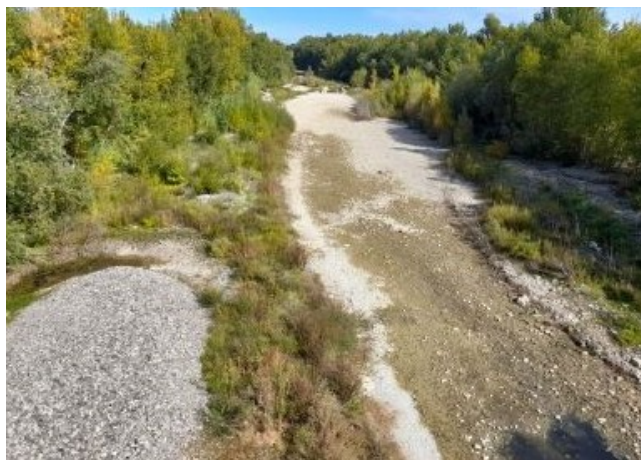
Ci-dessus : l'Agly à sec à Espira de l'Agly

Par ailleurs, la mise en place d'arrêtés de restrictions dès le mois de juin jusqu'en novembre, allant jusqu'à une diminution de 50% des prélèvements en eau pour l'irrigation, appuie également ce constat.